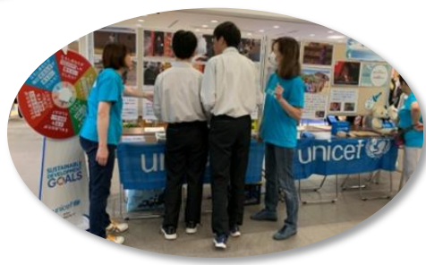
フレンテフェスタ2024