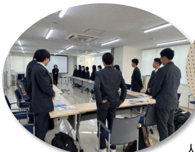
人権フィールドワーク