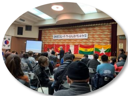
日本語でスピーチ