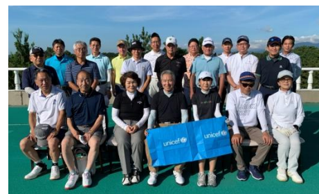
チャリティーゴルフコンペ (団体賛助会員 & 協会役員懇親会)